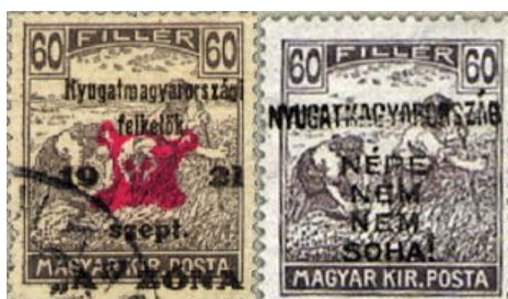
József Attila: Nem, nem soha! c. verse a Horthy-korszak egyik legerőteljesebb propaganda szlogenjévé vált, ami azt fejezi ki, hogy soha nem hagyják elveszni a megszállott országrészeket. A két bélyegen a Nyugat-magyarországi területeken létrehozott Lajta bánság felülnyomata látható