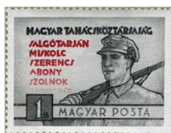
Propagandaszöveg 1919-es Tanácsköztársaság idején kiadott bélyegeken