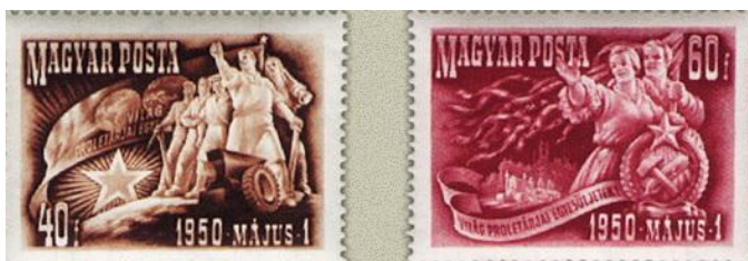
Balra: A világ pletetárjai egyesüljenek! feliratú bélyeg május 1. re, a munkások ünnepére emlékeztet.

Jobbra: Legdrágább kincstünk a gyermek! Harcolunk a békéért, a jobb életért! Jó tanulással harcolunk a békéért! Szabad hazában boldog ifjúság! A szocializmus építői leszünk!