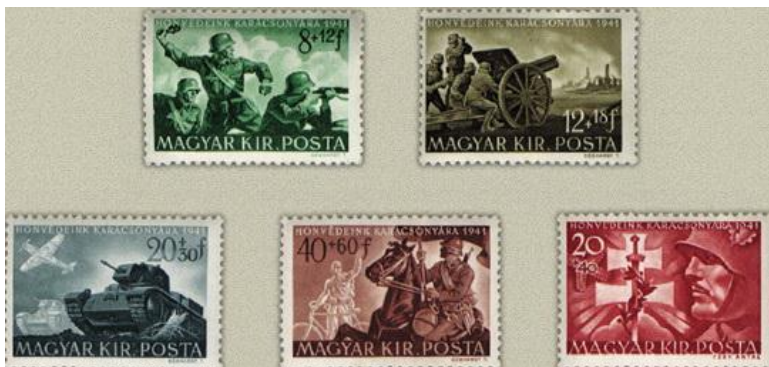
A második világháborúban harcoló magyar hadsereg hősiességét bemutató, propagandisztikus bélyegsorozat

Hitler arra kérte Horthyt, hogy a Jugoszlávia elleni akcióban Magyarország is vegyen részt: tegye lehetővé a német csapatok felvonulását, cserébe elismeri az ország területi igényeit Jugoszlávia felett. Horthy ezt kész volt teljesíteni. Teleki viszont nem volt hajlandó vállalni, ezért április 3-án öngyilkosságot követett el. Ezt követően Horthy Bárdossy Lászlót nevezte ki a kormány élére, aki kitarthatott a Jugoszlávia elleni támadás mellett. A második bécsi döntés után fél évvel, a Jugoszlávia elleni német támadás után – 1941 áprilisában – a magyar