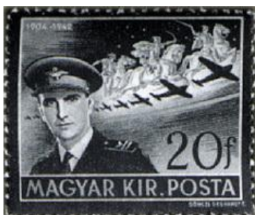
Az 1942-ben repülőbalesetben elhunyt Horthy István kormányzóhelyettes emlékére kiadott gyászbélyeg

Miután a romániai Szörényváron 1940. augusztus 16-24. között folytatott román–magyar tárgyalások nem vezettek eredményre, és mivel a tengelyhatalmak mindenképp el akarták kerülni a fegyveres konfliktus kirobbanását, a német és az olasz kormány a magyar és román kormányok képviselőit Bécsbe rendelte, és a közöttük folyó vitát döntőbíráskodás révén rendezte.