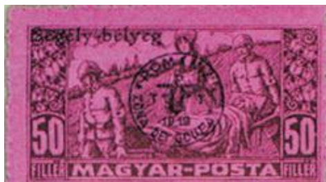
1919. Debrecen - Román megszállás. Segélybélyeg