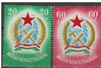
A Magyar Népköztársaság címere, 1950-es bélyegek