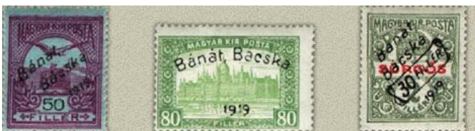
1919. Bánát – Bácska felülnyomat magyar bélyegeken a román és a szerb helycsere intervallumában