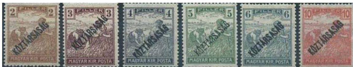
A filléres értékű bélyegek: az Arató-Parlament bélyeg (1916) aratós változatának Köztársaság feliratú felülnyomata. 1

1919 februárjában a kormány rendőri erővel lépett fel két, nemrégiben megalakult szélsőséges szervezettel szemben: feloszlatta a diktatórikus jobboldali kormányzatot és a történelmi határok fegyveres védelmét követelő Magyar Országos Véderő Egyletet, a Kommunisták Magyarországi Pártjának harminckét vezetőjét, köztük Kun Bélát pedig vizsgálati fogságba záratta.