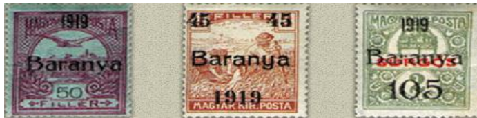
1919. „Baranya“— Szerb megszállás