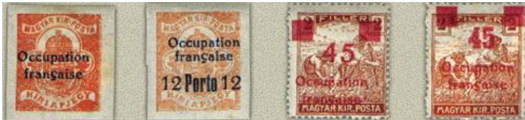
1919. Arad-Francia megszállás „Occupation Francaise“ felirat