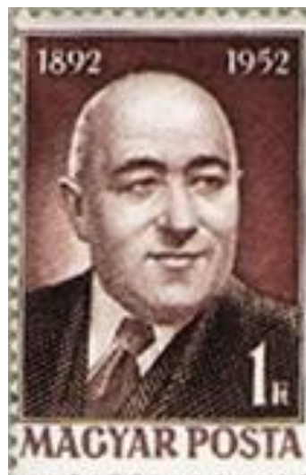
Rákosi Mátyás 60. születésnapja alkalmából kiállított emlékbélyeg