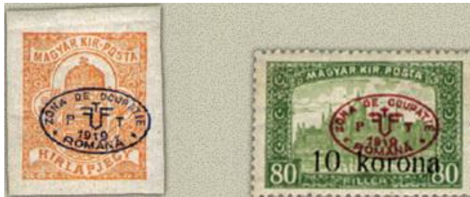
1919. Debrecen-Román megszállás „Zona de ocupatie Romana“