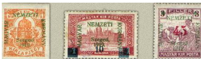
1919. szegedi felülnyomat, Magyar Nemzeti Kormány felirattal