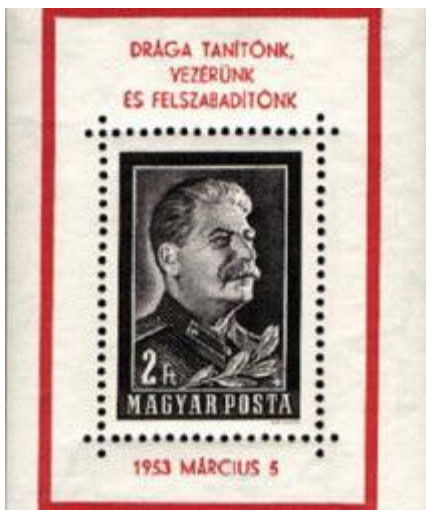
Kisív, 1953. Sztálin halálára emlékezve: Drága tanítónk, vezérünk és felszabadítónk (!!!)